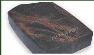
SPOMENIK SA OBORENIM IVICAMA