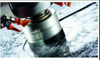
POLIRANJE U PADU